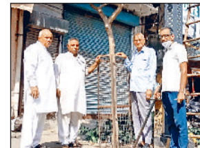
गोहाना। पुराने पौधों के टी गार्डों को व्यवस्थित करते हुए संगठन के सदस्य।