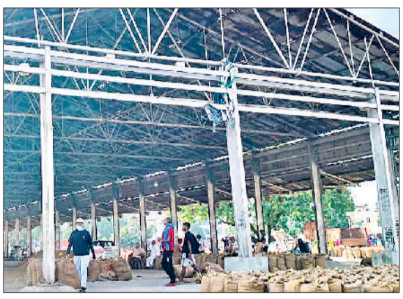
पिछले साल महज 1253 क्विंटल की हुई थी खरीद

है, लेकिन इस बार धान की कटाई समय से पहले शुरू होने के कारण किसानों ने सरकार से जल्द खरीद प्रक्रिया शुरू करने की मांग की थी। प्रदेश सरकार ने इस पर केंद्र सरकार से चर्चा की और अब 22 सितंबर से ही खरीद प्रक्रिया शुरू करने का निर्णय लिया गया। फिलहाल सोनीपत अनाज मंडी को ही केंद्र बनाया गया है, जहां पीआर धान के साथ बाजरे की भी सरकारी खरीद होगी।