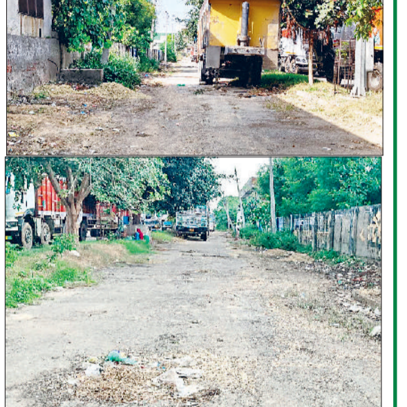
सोनीपत। मंडी में आने वाले रास्ते में खड़ा ट्राला व सड़क मार्ग।

पिछले साल के आंकड़े ►► बासमती धान 5,99,000 क्विंटल धान किस्म 1509- 5,15,000 क्विंटल