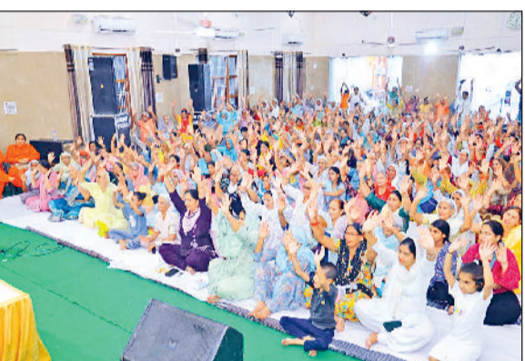
कार्यक्रम के दौरान मौजूद श्रद्धालुगण।