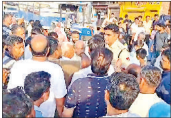
हरिभूमि न्यूज। सोनीपत

अधिकारियों ने दिया आश्वासन, दस दिन का मांगा समय