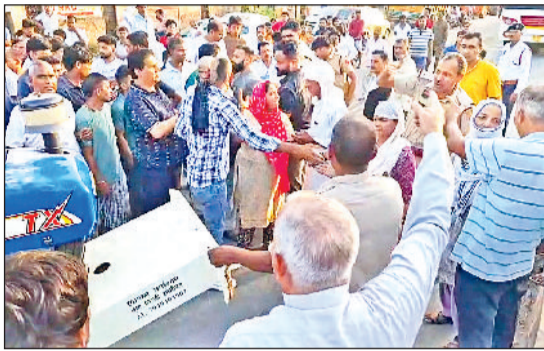
सोनीपत। जाम लगाए स्थानीय निवासी।

पहले से वन-वे घोषित मार्ग पर दोनों ओर वाहनों की लंबी कतारें लग गईं, जिससे घंटों तक यातायात अव्यवस्थित रहा और वाहन चालकों को भारी दिक्कतों का सामना करना पड़ा