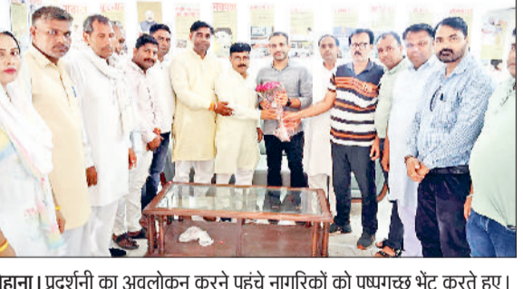
गोहाना। प्रदर्शनी का अवलोकन करने पहुंचे नागरिकों को पुष्पगुच्छ भेंट करते हुए।