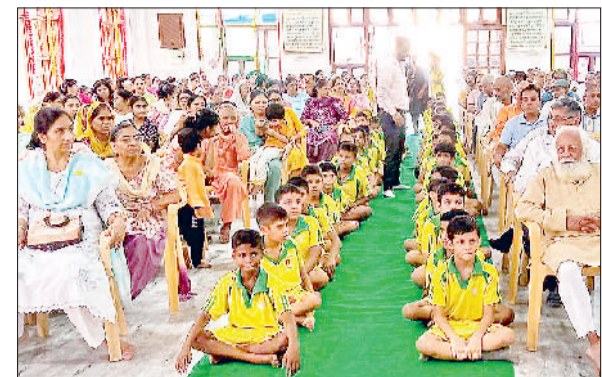
सोनीपत। कार्यक्रम के दौरान मौजूद आर्य वीर एवं प्रबुद्धजन।