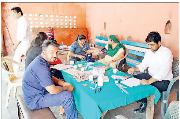
सोनीपत। जांच शिविर में उपस्थित चिकित्सक जांच करते हुए।