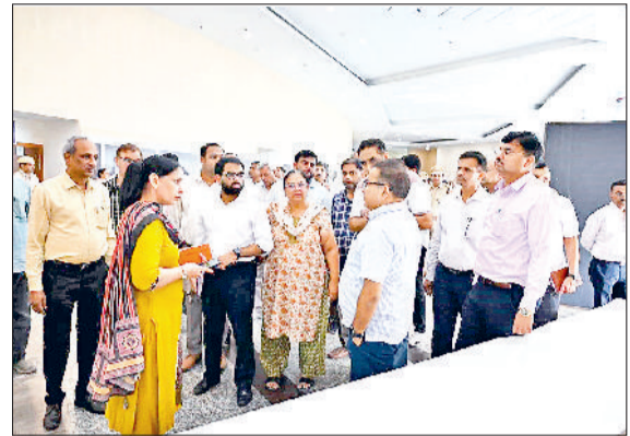
सोनीपत। निरीक्षण के दौरान मौजूद अधिकारियों।

प्रदेशभर में 02 अक्टूबर तक मनाए जा रहे सेवा पखवाड़ा अभियान के अंतर्गत जिला स्तर पर दीन बंधू छोट्टराम विज्ञान एवं प्रौद्योगिकी विश्वविद्यालय (डीसीआरयूएस्टी) मुरथल में 22 सितंबर को आयोजित होने वाले मुख्यमंत्री नायब सिंह सैनी के कार्यक्रम को लेकर जिला प्रशासन द्वारा सभी तैयारियों पूरी की गई हैं। तैयारियों को जायजा लेने के लिए उपायुक्त सुशील सारवान ने रविवार को सभी अधिकारियों के साथ आयोजन स्थल का निरीक्षण किया। इस दौरान उपायुक्त ने सुरक्षा व्यवस्था, पार्किंग प्रबंधन, मंच व्यवस्था, लोगों के बैठने की सुविधा, पेयजल, शौचालय,