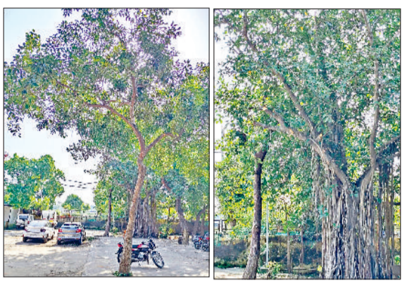
सोनीपत। अस्पताल में पेड़ों की गई छटाई।

उन्होंने कहा कि सोमवार को मुख्यमंत्री दोपहर बाद 03 बजे डीसीआरयूएस्टी के सभागार में आयोजित कार्यक्रम में बतौर मुख्यातिथि शिरकत करेंगे। उपायुक्त ने बताया कि कार्यक्रम के दौरान मुख्यमंत्री विकास एवं पंचायत विभाग की विभिन्न परियोजनाओं का उद्घाटन व शिलान्यास करेंगे। इनमें प्रदेशभर में महिला सांस्कृतिक केन्द्रों का उद्घाटन, इनडोर का उद्घाटन, योग एवं व्यायामशालाओं का उद्घाटन तथा 225 गांवों में फिर्नी पर स्ट्रीट लाइट्स का शुभारंभ शामिल है।