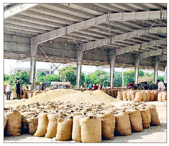
सोनीपत। मंडी में बनी शैड के नीचे धान की फसल व बोरियां।

बाजरा उत्पादकों को अभी करना होगा इंतजार और 1509 की आवक मंडियों में हुई शुरू हरिभूमि न्यूज ►► सोनीपत जिले के किसानों के लिए राहत भरी खबर आई है। लगातार मांग के बाद सोनीपत अनाज मंडी में सोमवार (22 सितंबर) से पीआर धान की सरकारी खरीद शुरू की जा रही है। सरकार की ओर से खरीद प्रक्रिया को लेकर सभी तैयारियां पूरी कर ली गई हैं और अधिकारियों को नियुक्ति कर दी गई है। हालांकि, बाजरा उत्पादक किसानों को अभी थोड़ा इंतजार करना पड़ेगा क्योंकि बाजरे की सरकारी खरीद 1 अक्टूबर से ही शुरू होगी। मंडी में तैयारियां भले ही पूरी हो गई हैं, लेकिन सड़कों पर अवैध रूप से पार्किंग में ट्रक खड़े हैं। वहीं सड़कों की हालत भी ठीक नहीं है।