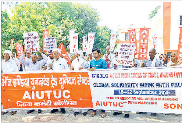
सोनीपत। विरोध प्रदर्शन करते हुए यूनियन के पदाधिकारी एवं सदस्यगण।

राई विधानसभा क्षेत्र के विकास कार्यों को निरंतर गति देते हुए विधायक कृष्णा गहलावत ने रविवार को गांव प्रीतमपुरा से नाथुपुर तक बने वाली सड़क के नवीनीकरण एवं मजबूतीकरण कार्य का शुभारंभ किया। यह सड़क हरियाणा कृषि विपणन बोर्ड द्वारा 75 लाख रुपये की लागत से बनाई जाएगी। विधायक कृष्णा गहलावत ने नारियल फोड़कर निर्माण कार्य का शिलान्यास किया और कहा कि नाथुपुर तक की भी क्षेत्र के विकास की धुरी होती है। अच्छी सड़कों के अभाव में न केवल आमजन को आवागमन में कठिनाइयों का सामना